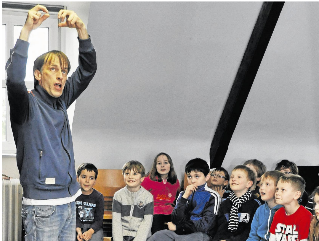
Um warm zu werden, berichtete der Autor den Kindern von seiner Begegnung mit einem Faultier.