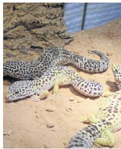
Diese drei weiblichen Geckos suchen ein artgerechtes Zuhause.

KREIS UNNA. Die Mitarbeiter des Kreistierheims Unna stellen diese Woche drei Leopardgeckos vor. Diese befinden sich erst seit zwei Wochen im Tierheim. Alle drei Geckos sind Weibchen. Die Tiere suchen ein artgerechtes, fachkundiges Zuhause. Wie alt die Geckos sind, lässt sich nicht genau sagen, sie haben bereits eine ordentliche Größe.