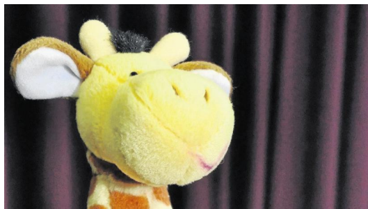
Im Buch leuchten die Giraffen sogar.